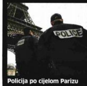
Policija po cijelom Parizu

Što to znači? Odmah po pokretanju plana policijske postrojbe se pojavljuju ispred škola, medija, javnog prijevoza, religijskih ustanova te prodajnih centara. Postavljaju se operativni krizni centri, odakle se vodi upravljanje akcijama, a povećava se i prisutnost vojnih postrojbi u državi. Otkazuju se školski izleti, a ograničava se i parkiranje vozilima u blizinama škola. Policija i vojska dobijaju povećane ovlasti za nasumičnu kontrolu građana. (D. Ra.)