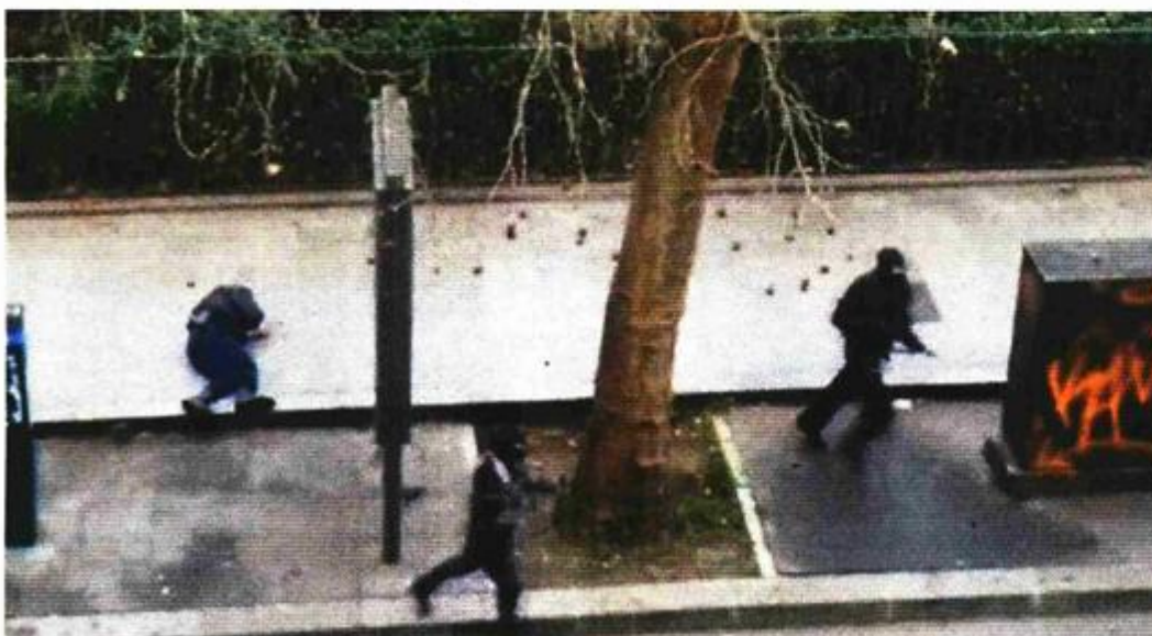
Nakon masakra u redakciji tjednika, teroristi su na ulici napali i ubili policajca