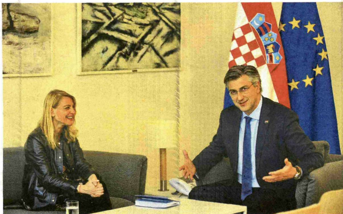
Naša novinarka Tihana Tomičić i premijer Andrej Plenković

- Kako bismo vratili te ljude na tržište rada, Hrvatski zavod za zapošljavanje usvojio je kriterije za korištenje travanjskog paketa mjera kroz koje omogućujemo poslodavcima koji su otpustili radnike u ranijem periodu da koriste mjere za travanj i svibanj uz uvjet povratka