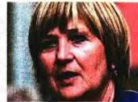
Ruža Tomašić eurozastupnica s liste HDZ-a

'Umjesto jasne osude, vi ste dijelili lekcije susjedima i pozivali na zatvaranje Haaškog suda'