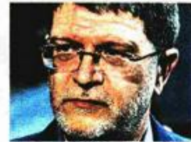
Tonino Picula eurozastupnik iz SDP-a

'Ratnohuškačka retorika bila je toliko neprihvatljiva da je tražila reakciju Srbije, koje nije bilo'