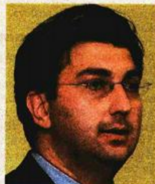
Andrej Plenković (HDZ)