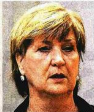
Ruža Tomašić (nezavisna zastupnica s liste HDZ-a)