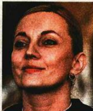
Marijana Petir (HSS)