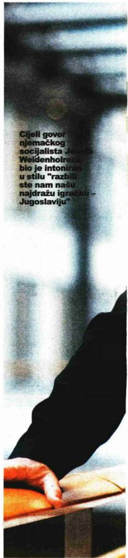
Cijeli govor njemačkog socijalista Joscha Weidenholza bio je intoniran u stilu "razbili ste nam našu najdražu igračku - Jugoslaviju"

Stare jugoslavenske strukture, matična ploča britanske politike, u Sloveniji uopće nisu demontirane, kao ni u Hrvatskoj, s tom razlikom da o njihovu postojanju na ovaj način među slovenskim građanima ne postoji nikakva svijest. Zanimljivo je i to da je zastupnik u EP-u iz Slovenije Igor Šoltes iz grupacije Zelenih unuk Edvarda Kardelja, koji je također održao govor o rezoluciji u slučaju